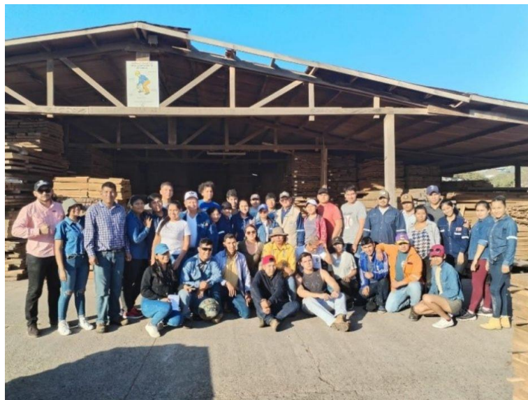
Foto 2: Estudiantes que participaron en instalaciones de la empresa CIMAL

Las prácticas de clasificación de madera se llevaron a cabo en las instalaciones de la empresa CIMAL donde los estudiantes aplicaron los conocimientos impartidos en aula. (Foto 2)