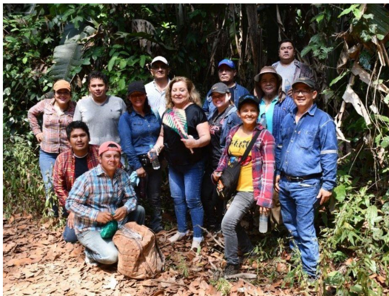
Foto 3: Participantes del curso de Riberalta en las prácticas de campo