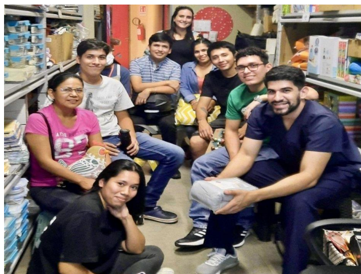
Foto 1: Participantes del Taller de Inducción FSC en Casa Ideas Santa Cruz – Turno mañana

Casa Ideas Bolivia demostró, una vez más, su compromiso con la sostenibilidad ambiental al llevar a cabo el taller de inducción sobre Certificación Forest Stewardship Council (FSC) para sus colaboradores. Este evento que se desarrolló el 5 de mayo/2024, subrayó la importancia del sello