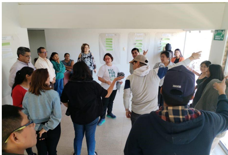
Foto 7: Prácticas de los criterios de Estándar realizado por los participantes.

Asimismo, convocamos a la Autoridad de Tierras y Bosque para exponer el Sistema Boliviano de Certificación de Bosques e Incentivos (SBCBI) (Foto 8), con el fin que los estudiantes y participantes en general del curso puedan tener un mayor entendimiento de ambos sistemas de certificación y compartir los conceptos de manejo forestal certificado de la ABT y el FSC, que en cierta medida pueden llegar a ser compatibilizados.