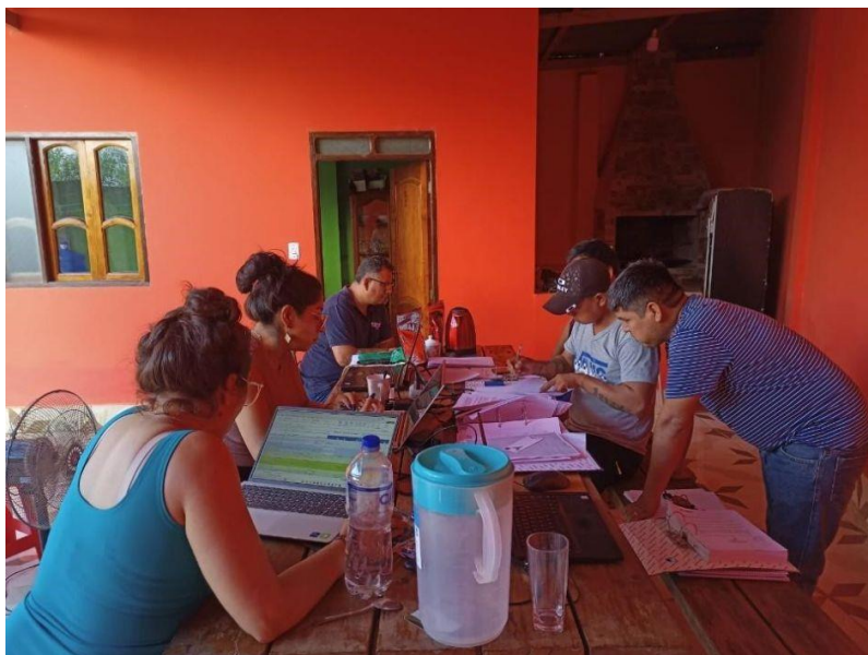
Foto 4: Comunidad San Antonio Km 60 practicando la Autoevaluación del PMC