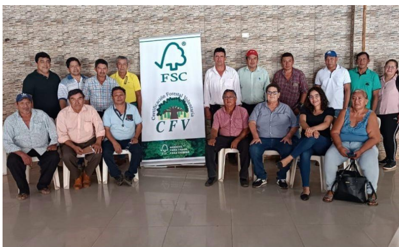
Foto1: Taller con ASLs en San Ignacio

Inicialmente para encarar el presente trabajo se vio por conveniente seleccionar unidades de manejo forestal mayores a 5000 hectáreas, considerando que áreas menores puedan no ser rentables para la certificación FSC, también se tomaron en cuenta otros criterios importantes, como la legalidad, gobernanza al interior de comunidades y disponibilidad de personal para ser capacitados. Con base en la lista de preselección se determinó los principales lugares para la socialización del sistema de Certificación FSC serían: Concepción, San Javier, San Ignacio (Foto 1), Guarayos, Ixiamas, Pando y Riberalta.