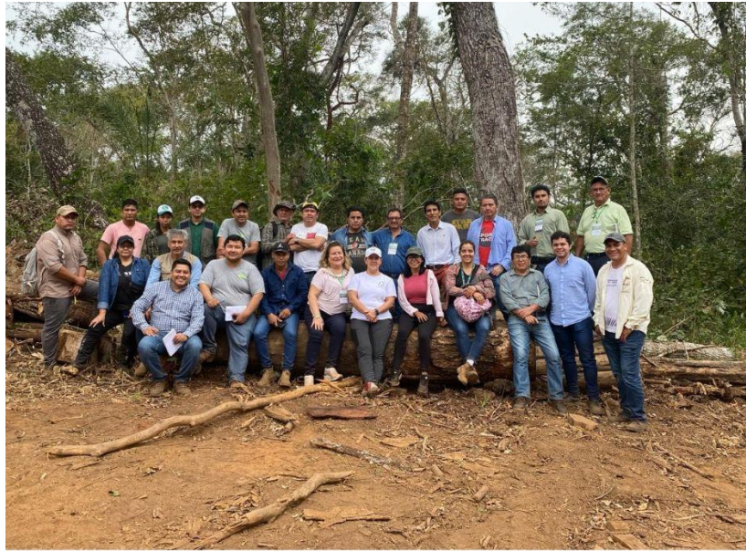
Foto 2: Participantes de los talleres de Santa Cruz y Concepción en la Comunidad Palmarito de la Frontera

Frontera (Foto 2), que estaba a cargo de la Gerente de Políticas de Latinoamérica, implementando una metodología participativa y dinámica, para la mejor comprensión de los cambios e inclusiones determinadas por el FSC Internacional.