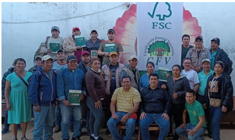
Foto 2: Participantes del taller desarrollado en la Central Indígena de Comunidades de Concepción

Hasta el 30 de junio de la presente gestión, a través de la campaña “Explorando Bolivia Forestal” se ha realizado la socialización del sistema de Certificación FSC a 51 PGMF en los municipios de San Javier, Concepción, San Ignacio de Velasco, Riberalta y Cobija. Contando con la participación 116 personas, entre ellos representantes de empresas forestales, Agrupaciones Sociales del Lugar, comunidades campesinas e indígenas, autoridades municipales, ABT y Agentes Auxiliares.