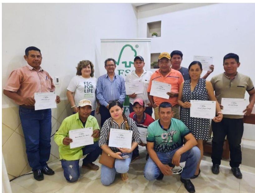
Foto 5: Agentes Auxiliares y dirigentes de comunidades en taller de Procedimiento de Mejora Continua en Riberalta.

La socialización del sistema de certificación forestal FSC permite obtener los conocimientos necesarios y suficientes para encarar un proceso de Certificación FSC y está dirigido a todo usuario forestal que tenga un PGMF aprobado por la autoridad competente.