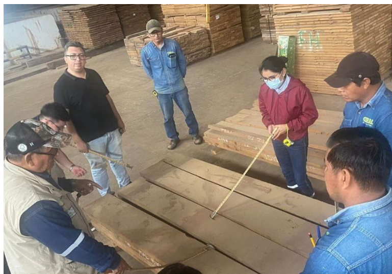
Foto 4: Colaboradores de empresa CIMAL realizando las prácticas de clasificación

En ambos cursos los participantes tuvieron la oportunidad de realizar prácticas aplicando el conocimiento adquirido en aserrío y clasificación de madera, optimizando procesos que contribuyan a un mejor rendimiento para una gestión de calidad óptima.