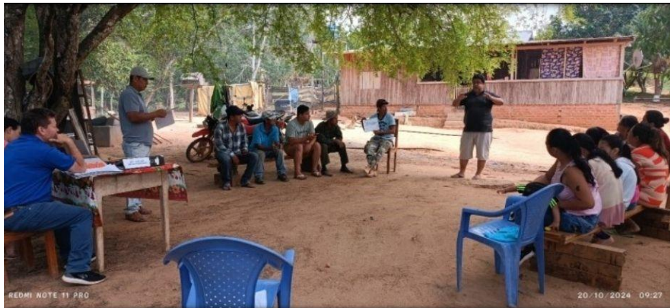
Fotografía 1: Explicación sobre la reordenación de la divisiones administrativas y su importancia para el cumplimiento de los requisitos de la certificación FSC, PGMF Comunidad San Pedro.

El CFV felicita a las comunidades y a la empresa, por demostrar a Bolivia y al mundo que se puede establecer modelos de negocios y aprovechamiento sostenible de los recursos del bosque que cumplen con los tres pilares fundamentales del FSC, ambiental mente adecuado, socialmente benéfico y económicamente viable.