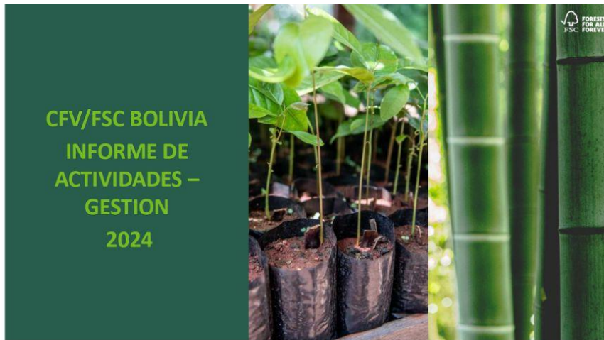
Foto 1: Presentación del Informe de resultados de actividades 2024 CFV/FSC Bolivia.

Asimismo, se presentó el proyecto de Bosques Tropicales, exclusivo de FSC Internacional, donde Bolivia fue elegida como parte del programa global, comprometiéndose a certificar 85,000 hectáreas adicionales en 2025, hasta la fecha se seleccionaron cuatro Unidades de Manejo Forestal (UMF) de las 175 socializadas en 2024: Comunidad campesina Bella Brisa, Palmira, Cachuelita Alto y Los Indios.