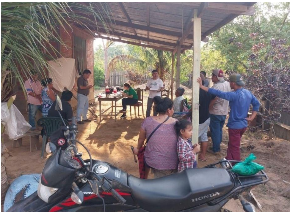
Fotografía 2: Asamblea de los beneficiarios del PGMF de la comunidad San Jorge, la entidad grupal esta difundiendo informes de aprovechamiento.