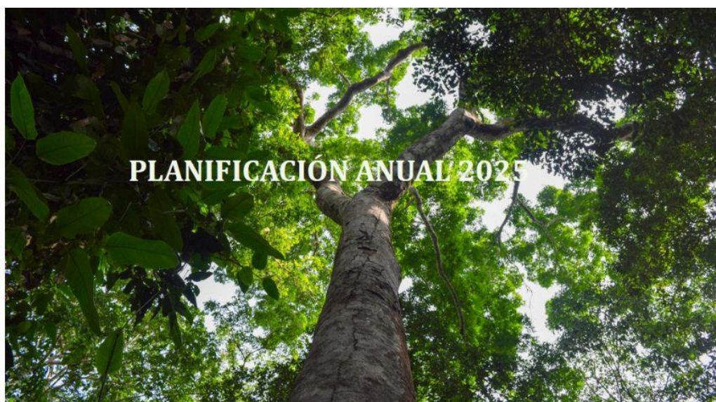
Foto 3: Presentación de la Planificación Anual 2025, estrategias para fortalecer la certificación FSC en Bolivia.

El 2025 se perfila como un año determinante para el FSC Bolivia. A través de una planificación estratégica sólida y el compromiso de sus aliados, se busca transformar el manejo forestal en el país, promoviendo la certificación, fortaleciendo el mercado de productos certificados y consolidando su institucionalidad. Con estas acciones, Bolivia seguirá avanzando hacia un modelo sostenible que garantice el equilibrio entre la conservación de los bosques, el desarrollo económico y el bienestar de las comunidades que dependen de ellos (Foto 3).