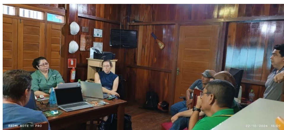
Fotografía 6: Reunión de apertura de la auditoria de certificación