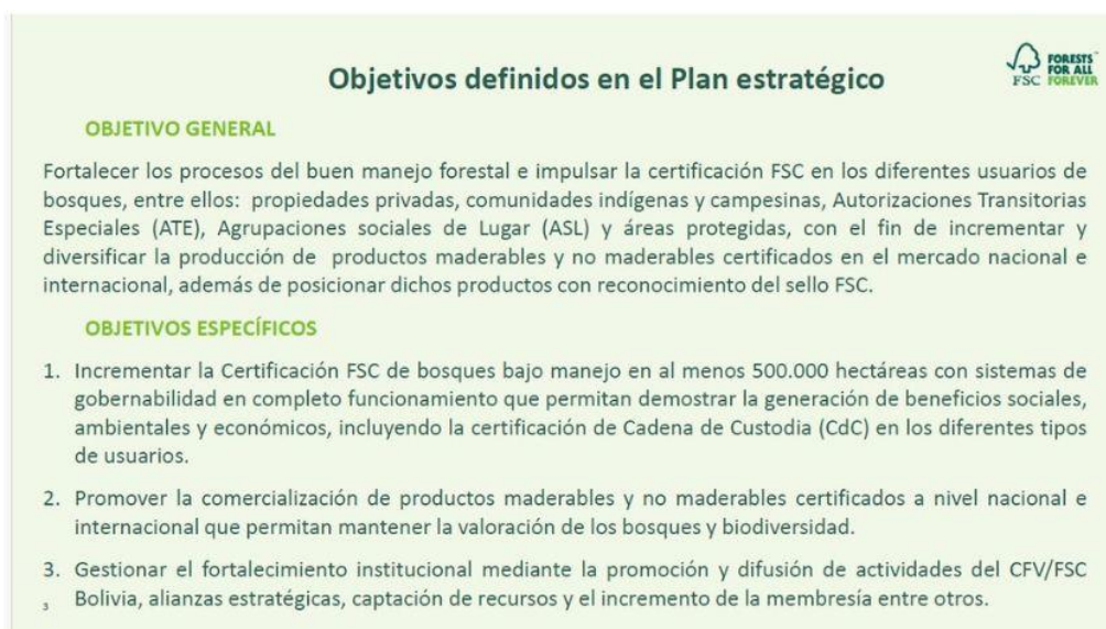
Foto 2: Objetivos definidos en el plan Estratégico CFV/FSC Bolivia.