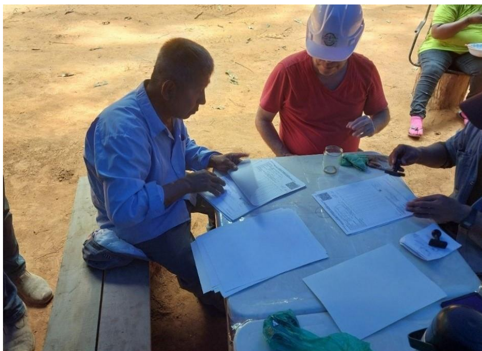
Fotografía 4: Representante legal del PGMF de la comunidad San Jorge y el Ing Forestal encargado de la entidad grupal, revisando los informes de rodeo y llenado los CFO A1, para el despacho de las troncas.