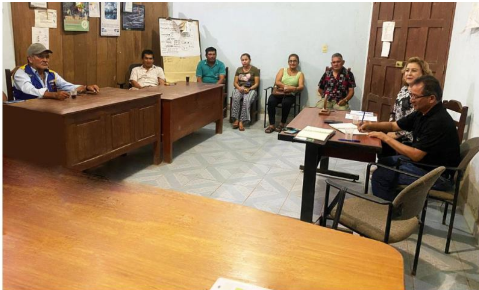
Foto 2: Reunión de representantes de las ASLs de Ixiamas y CFV/FSC Bolivia.

Durante una reunión con la Asociación de ASLs de Ixiamas (ADAFIX), que contó con la participación de siete agrupaciones (El Triunfo, San Antonio, Ixiamas, Caoba, 7 Palmas, Copacabana y Candelaria), se evidenció la difícil situación del mercado maderero que ha experimentado una notable contracción en los últimos años. No obstante, existe un fuerte interés por avanzar en procesos de certificación FSC (Foto2) y mejorar su situación actual.