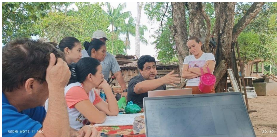
Fotografía 5: Reunión informática con los beneficiarios del PGMF de la comunidad San Pedro.