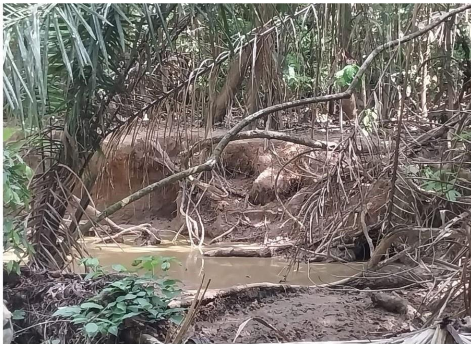
Fotografía 3: Zona de conservación para la fauna, existente en el PGMF de la comunidad San Pedro (Barrero)